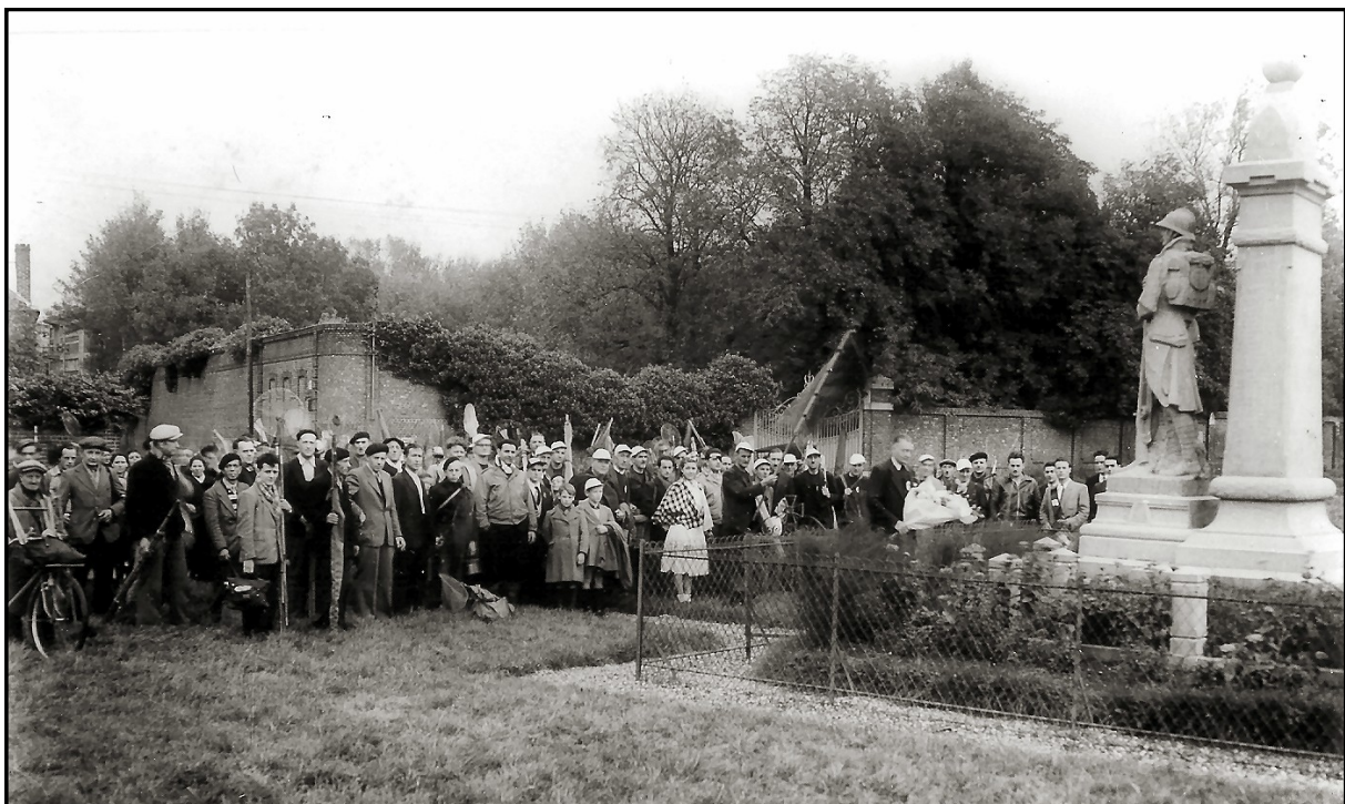
Dépôt de gerbe au monument aux Morts de Proville au milieu du XXe siècle (document médiathèque de Cambrai)

Au mois d'août 1914 les Allemands envahissent la Belgique et le nord de la France, c'est-à-dire qu'ils occupent Cambrai et Proville. Ils ne seront chassés qu'en 1918. Pas loin de un million et demi de soldats français mourront au combat, dont 25 Provillois. Nous lirons leurs noms tout à l'heure.